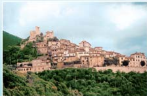
Panoramica di Roccamandara