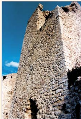
Dopo il restauro

L'intera fortificazione muraria risale al X secolo e prende il nome, dall'episodio secondo il quale il Papa Nicolò II, nell'anno 1059, si rifugiò nella rocca e si difese grazie alla generosità degli abitanti di Roccamandara dall'attacco dei Crescenzi seguaci di Benedetto X. Nel corso dei secoli la Torre e le sue mura hanno sempre rappresentato un significativo punto di riferimento per la popolazione di Roccamandara e dei paesi circostanti, segnando in modo indelebile la storia ed il paesaggio dei luoghi.