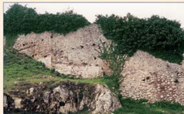
Particolare della cinta muraria prima del recupero