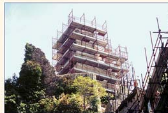
Durante i lavori di restauro