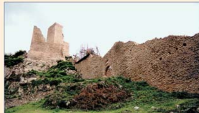
Torre e cinta muraria dopo i restauri