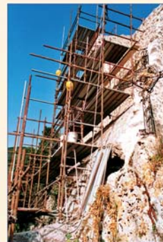
Durante i lavori di restauro