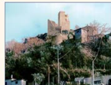
Torre e Fortificazione dopo il recupero

L'intera fortificazione muraria risale al X secolo e prende il nome, dall'episodio secondo il quale il Papa Nicolò II, nell'anno 1059, si rifugiò nella rocca e si difese grazie alla generosità degli abitanti di Roccamandara dall'attacco dei Crescenzi seguaci di Benedetto X. Nel corso dei secoli la Torre e le sue mura hanno sempre rappresentato un significativo punto di riferimento per la popolazione di Roccamandara e dei paesi circostanti, segnando in modo indelebile la storia ed il paesaggio dei luoghi.