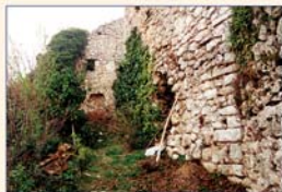
Particolari della Torre prima del restauro