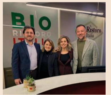
BioRistoro Italia. Il Team

Nel 2025 la società ha intrapreso una fase di rinnovamento strategico, a seguito della nomina, da parte dell'Amministrazione, di tre nuovi manager (una donna e due uomini) per ottimizzare la gestione delle complesse dinamiche del mercato dei servizi di ristorazione e favorire l'espansione dei vari segmenti di business. Una scelta strategica che si è tradotta in risultati significativi già nel primo anno. Un elemento centrale del percorso è l'adozione di un Sistema di Gestione sulla parità di genere, nato per regolamentare lo svolgimento del lavoro e ottimizzare l'organizzazione delle risorse umane stabilendo obiettivi qualitativi e quantitativi finalizzati a promuovere e tutelare diversità e pari opportunità, fissando specifici